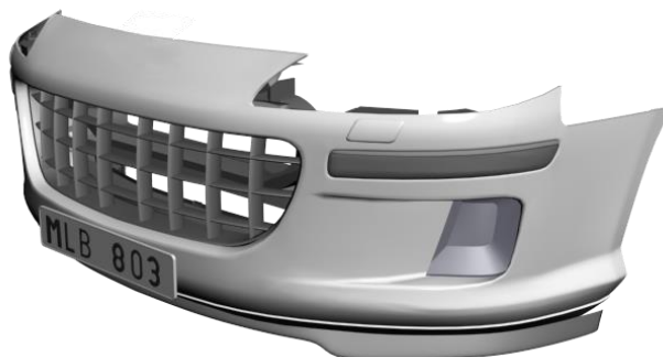
Exempel på stötfångare där "grillen" inte går att demontera och kräver extra svår maskering.

Tidsätts i CABAS under Övrigt och motivering anges i Noteringar.