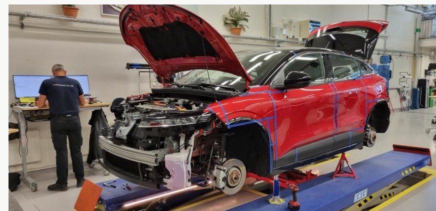
Renault Megane EV